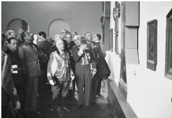
1 Fotografia storica che illustra l'allestimento del salone principale al piano primo, dove è visibile la parte inferiore di un grande crocifisso "annegata" nello zoccolo continuo

quelli di sicura esecuzione sia quelli attribuiti, insieme alle tavole eseguite dai suoi contemporanei o allievi.