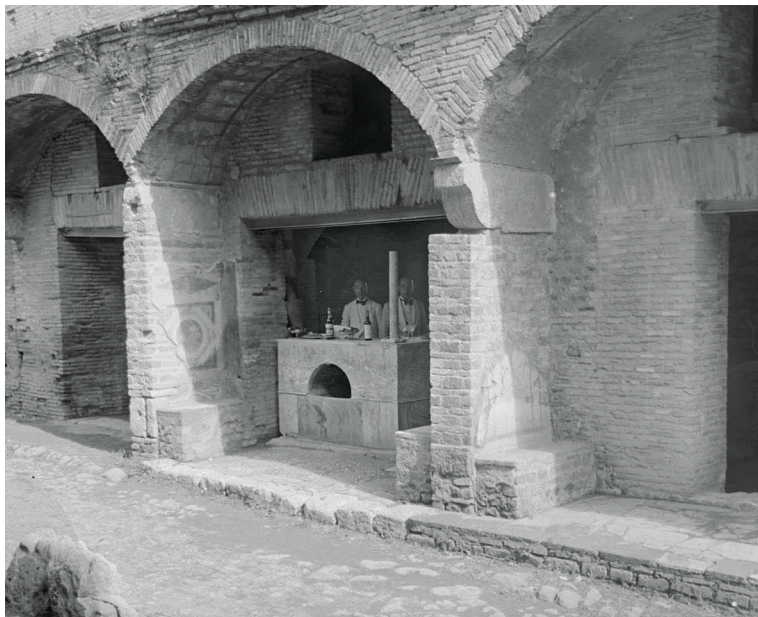
11 Buffet allestito nel Thermopolium in via di Diana, 1938, Ostia, Archivio Fotografico del Parco Archeologico di Ostia Antica, Fondo Raissa Calza, senza inventario