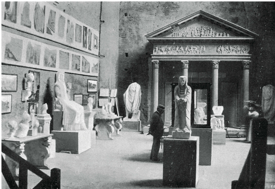
1 La sala della Spagna (da Le Esposizioni del 1911 1911, p. 409)