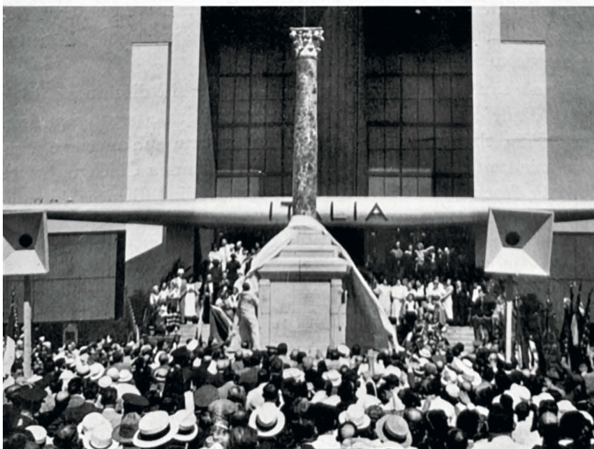
5-6 Lo scoprimento della colonna (da Spada Potenziani 1934, p. 47)