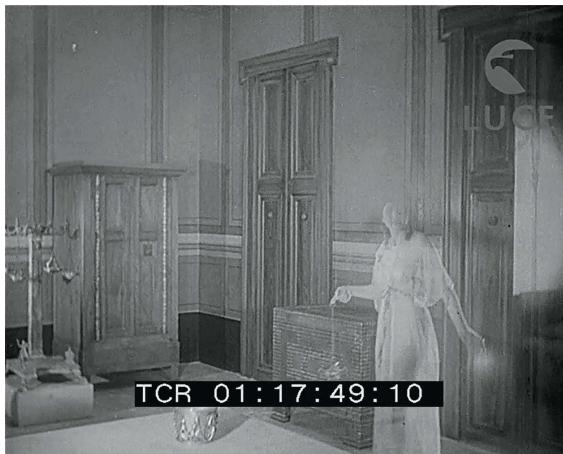
10 La casa augustea, frame da Nella luce di Roma , sonoro, b/n, 1938, min. 15.37, Roma, Archivio Storico Istituto Luce, inv. D044507

della casa, scorge, tra giochi di luci e ombre, animali, tende mosse dal vento, oggetti domestici e persino figure vestite in abiti d'epoca, in una rappresentazione onirica di un'antichità che, sebbene scomparsa, vuole essere ancora attiva nella contemporaneità (fig. 10) 64 .