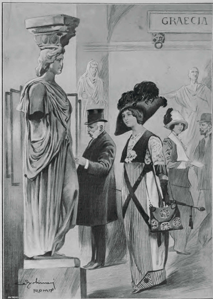
UN RAFFRONTO FRA LA DOSSA ANTICA E LA DOSSA MODERNA (impressione dal vero di A. Molinari).

ROMA. LA MOSTRA ARCHEOLOGICA ALLE TERME DIOCLEZIANE.