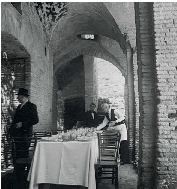
12 Tavola apparecchiata negli Horrea Epagathiana , 1938, Ostia