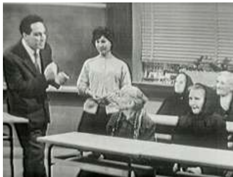
Fig. 1 – Frame da Non è mai troppo tardi , Rai Tv, 24 febbraio 1961.

La donna, di 57 anni, era riuscita per la prima volta a scrivere al figlio che viveva a Gorizia, il che fu motivo di grande gioia per entrambi. A quel punto, Manzi presenta un anziano signore che aveva appena imparato a scrivere il suo nome, il che significava che sarebbe stato in grado di ritirare la sua pensione senza dover fare una X al posto della firma. Invitato alla lavagna a dar prova delle sue capacità, l'anziano uomo fatica a scrivere per bene il suo cognome e insiste con il maestro per riprovarci, facendo dunque commuovere Manzi che, a quel punto, fa notare al pubblico le mani dell'uomo e dice «non sono mani di scrittore quelle, ma sono qualcosa di più, qualcosa di meglio». Questo programma è un esempio della funzione educativa che la TV pubblica ebbe fin dal suo concepimento 32 , ma lo è anche della visione collettiva dell'anziano come figura legata a un mondo rurale, devoto e analfabeta: molti degli esempi proposti dal maestro nelle varie puntate richiamavano infatti il mondo contadino e religioso.