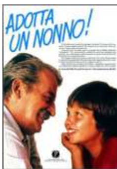
Fig. 2 – Pubblicità progresso, Adotta un nonno!, 1983

Gli anziani divennero quindi più visibili nelle riviste, in televisione e nelle pubblicità, anche se spesso, come già accennato, confinati in alcuni ruoli stereotipati. In ogni caso, si trattava ancora per lo più di un'attenzione istituzionale più che commerciale. Nel 1983, infatti, Pubblicità Progresso lanciò una campagna (sia cartacea che televisiva) dedicata agli anziani, il cui obiettivo era sensibilizzare l'opinione pubblica sulle problematiche legate alla vecchiaia, in particolare la solitudine e la distanza tra giovani e giovanissimi e le persone anziane (Fig. 2); la campagna si rivolgeva, infatti, soprattutto ai bambini e alle bambine. Come dichiarato dalla Fondazione Pubblicità Progresso, la campagna ebbe una risposta positiva, e fu sostenuta da iniziative giornalistiche e sociali incentrate sulle problematiche degli anziani; sempre secondo la Fondazione, il successo fu tale che proseguì dall'inverno per tutte l'estate, con grande diffusione da parte dei media 59 .