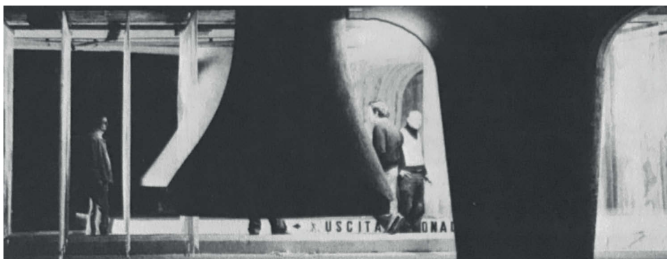
2 Luigi Moretti, parcheggio sotterraneo di Villa Borghese, vista aerea del cantiere, Roma, 1970