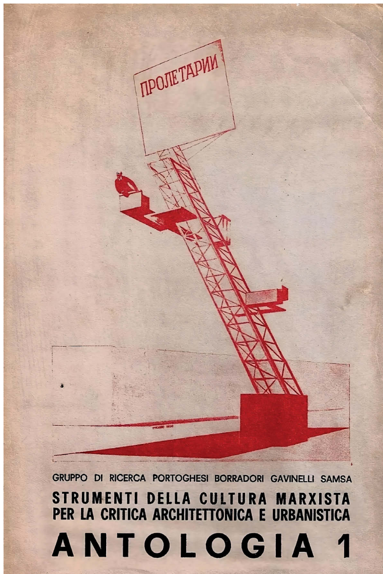
1 Copertina di Strumenti della cultura marxista per la critica architettonica e urbanistica , 1970