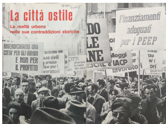
9 Copertina e quarta di copertina di La città ostile . La realtà urbana nelle sue contraddizioni storiche, 1976

L'esposizione nasceva anch'essa dalla sperimentazione didattica: nel colophon del catalogo, difatti, campeggiava la dicitura "Mostra didattica itinerante della 'Ricerca De Micheli'". Essa era composta da pannelli eliografati, ed era concepita con finalità didattiche allo scopo di analizzare la città come luogo di intensificazione delle contraddizioni sociali. L'analisi storica si articolava in tre momenti: il primo dedicato alla crescita urbana ottocentesca, ai tentativi di razionalizzazione e all'utopismo sociale di Owen e Fourier; il secondo alle trasformazioni urbane dei primi del Novecento, tra esaltazione del progresso e prime critiche legate ai conflitti di classe; il terzo alla seconda Rivoluzione industriale e alle contraddizioni urbane contemporanee, come il rapporto città-campagna, la residenza-lavoro, la disparità Nord-Sud e la speculazione edilizia. Una quarta sezione, Diritto alla città , era dedicata infine alle lotte per una pianificazione urbana democratica, con particolare attenzione alla questione abitativa. In questo contesto, i curatori sottolineavano: "È dunque alla città d'oggi che la parte finale della mostra rivolge la sua attenzione: alla città in cui viviamo, dove più aspre, in questi tempi recenti, si sono fatte le contraddizioni