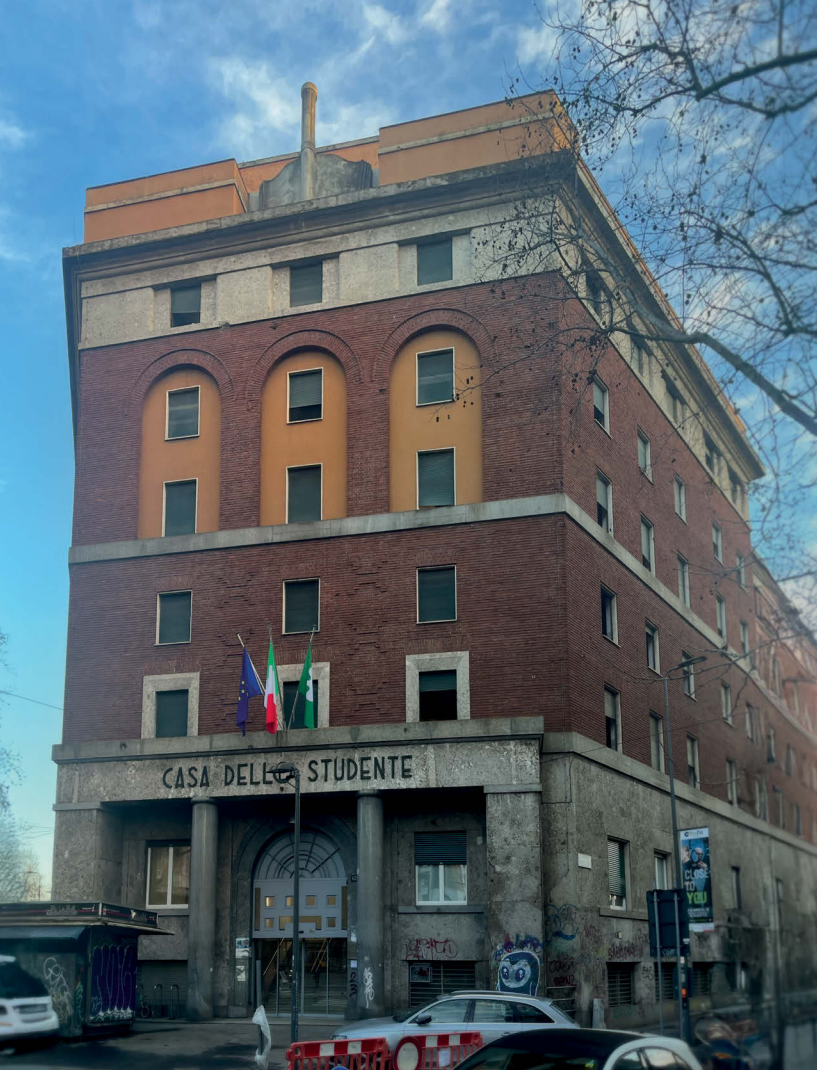
4 Fronte della Casa dello Studiante, attualmente Residenza Leonardo Da Vinci del Politecnico di Milano, 2024