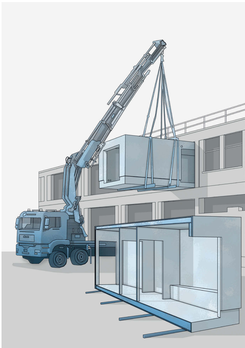
6 Sistema costruttivo del progetto sperimentale CasaZera, realizzato a Torino nel 2013 dallo studio Toussaint Robiglio Architetti (ridisegno dell'autore)